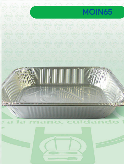
Molde de Aluminio Media Pavera AL-2923

Marca. INIX Precio Paquete. $30.00 Precio de Caja. $2,500.00