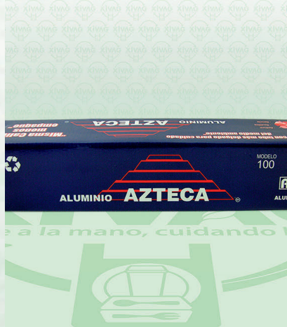
Papel Aluminio Azul Mod. 100 Azteca

Marca. AZTECA Precio Paquete. $195.00 Precio de Caja. $2,160.00