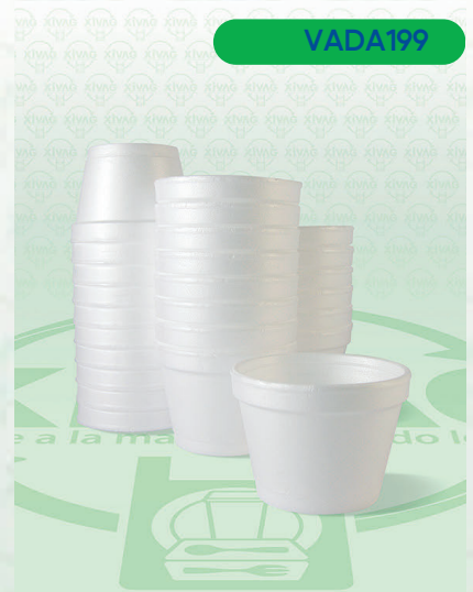
Vaso Térmico 4 oz. Eco Unicel

Marca. DART Precio Paquete. $24.00 Precio de Caja. $880.00