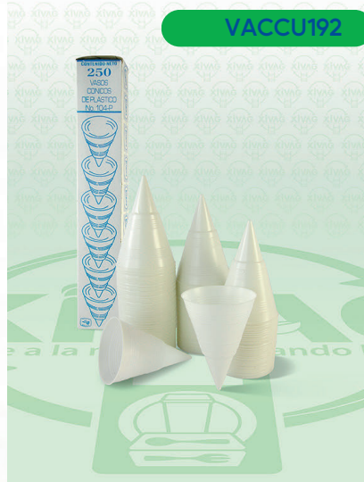
Vaso Cónico de Papel 106 P

Marca. CUEVAS Precio Paquete. $75.00 Precio de Caja. $840.00