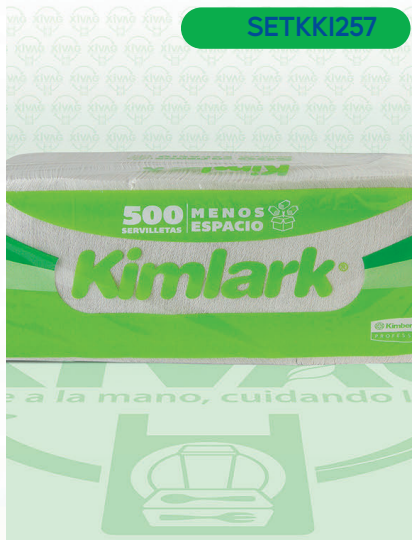
Servilleta Trad Kimlark 500 'sX12

Marca. KIMBERLY - CLARK Precio Paquete. $60.00 Precio de Caja. $696.00