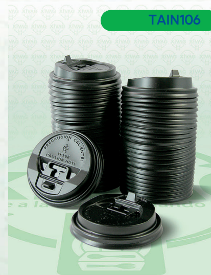
Tapa Negra Viajera para Vaso de Papel 8 oz. TPS08N

Marca. INIX Precio Paquete. $52.00 Precio de Caja. $960.00