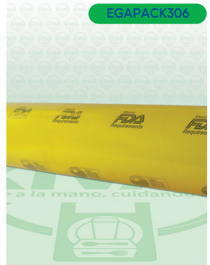
Vitafilm Egapack estirable F3X45

Marca. EGA PACK Precio Paquete. $500.00 Precio de Caja. $980.00