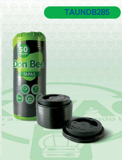
Tapa Universal Negra MrBee

Marca. DON BEE Precio Paquete. $95.00 Precio de Caja. $1,700.00