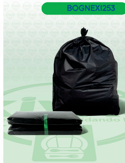
Bolsa a Granel Negra 60X90

Marca. XIVAG Precio Paquete. $65.00 Precio de Caja. $1,500.00