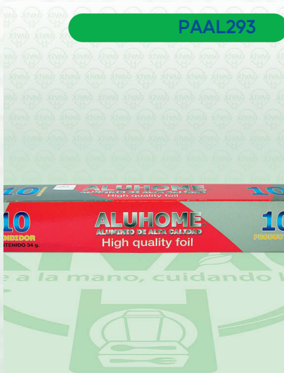
Papel Aluminio Aluhome Mod. 10 Rojo

Marca. ALUHOME Precio Paquete. $25.00 Precio de Caja. $480.00