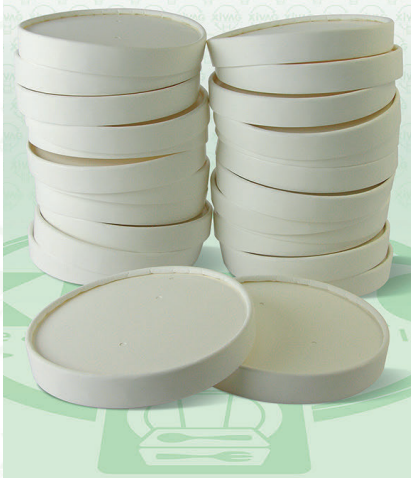
Tapa para Contenedor Deli DPC16

Marca. INIX Precio Paquete. $105.00 Precio de Caja. $2,000.00