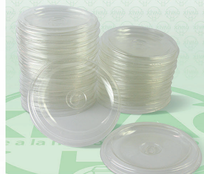
Tapa con Perforación L110

Marca. INIX Precio Paquete. $48.00 Precio de Caja. $880.00