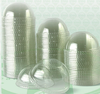
Tapa Luxury Domo con Orificio para Vasos 14 oz. DL92

Marca. INIX Precio Paquete. $88.00 Precio de Caja. $830.00