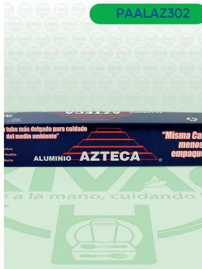
Papel Aluminio Azul Mod. 50 Azteca

Marca. AZTECA Precio Paquete. $100.00 Precio de Caja. $2,160.00