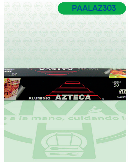
Papel Aluminio Negro Mod. 50 Azteca

Marca. AZTECA Precio Paquete. $80.00 Precio de Caja. $1,680.00