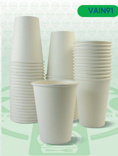
Vaso de Papel Económico Blanco 12 oz. VPP12

Marca. INIX Precio Paquete. $135.00 Precio de Caja. $2,500.00