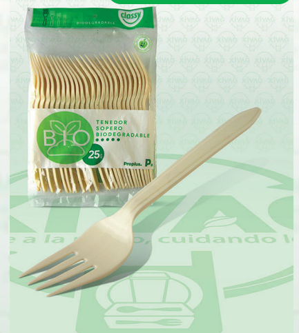
Tenedor Sopera Bio Classy

Marca. CLASSY Precio Paquete. $19.00 Precio de Caja. $680.00