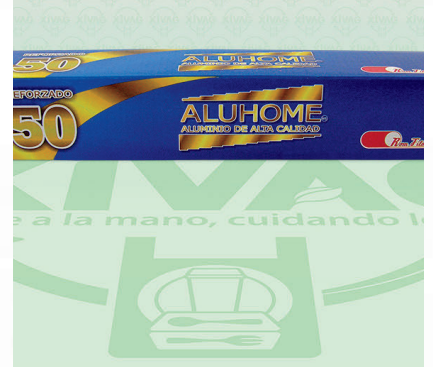
Papel Aluminio Aluhome Reforzado Mod. 50

Marca. ALUHOME Precio Paquete. $115.00 Precio de Caja. $2,625.00