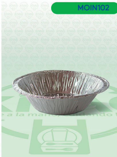
Molde de Aluminio para Pay Mini

Marca. INIX Precio Paquete. $25.00 Precio de Caja. $2,000.00