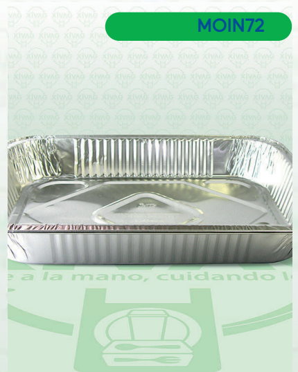
Molde Aluminio Pavera Rectangular AL-4130-R

Marca. INIX Precio Paquete. $40.00 Precio de Caja. $1,800.00