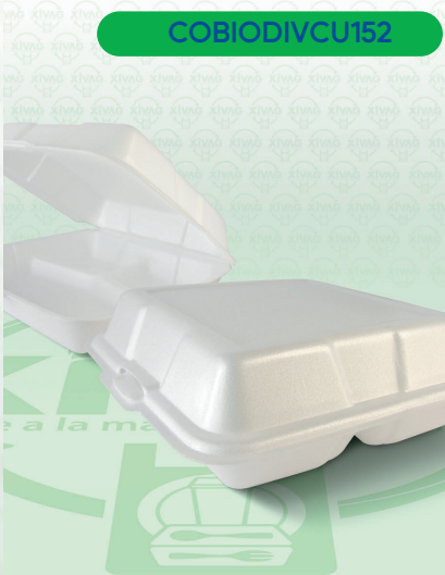
Contenedor Térmico 9X9 Bio con Divisiones

Marca. CUEVAS Precio Paquete. $340.00 Precio de Caja. $660.00