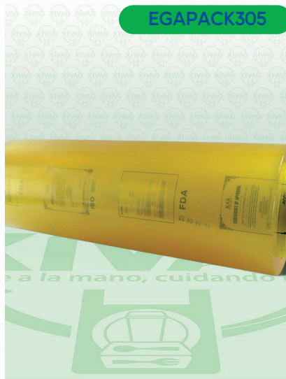
Vitafilm Egapack Estirable E3X38

Marca. EGA PACK Precio Paquete. $430.00 Precio de Caja. $840.00