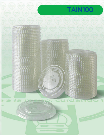
Tapa Domo Transparente con Orificio TS4 para Vaso 4 oz.

Marca. INIX Precio Paquete. $60.00 Precio de Caja. $570.00