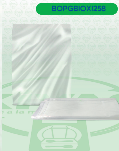
Bolsa Plástico a Granel Bio 60X90

Marca. XIVAG Precio Paquete. $80.00 Precio de Caja. $1,875.00