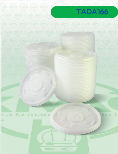
Tapa Traslúcida con Ranura para Popote 12SLMX

Marca. DART Precio Paquete. $105.00 Precio de Caja. $1,000.00