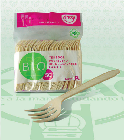
Tenedor Mediano Bio Classy

Marca. CLASSY Precio Paquete. $16.00 Precio de Caja. $560.00