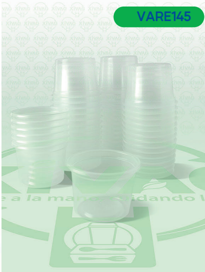
Vaso Plástico VP4CH

Marca. REYMA Precio Paquete. $40.00 Precio de Caja. $760.00