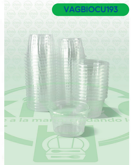
Vaso Gelat 14-C Bio

Marca. CUEVAS Precio Paquete. $62.00 Precio de Caja. $1,160.00