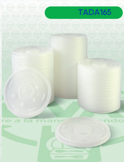
Tapa Traslúcida con Ranura para Popote 10SLMX

Marca. DART Precio Paquete. $75.00 Precio de Caja. $700.00