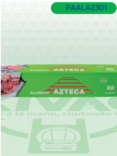
Papel Aluminio Verde Mod.100 Azteca

Marca. AZTECA Precio Paquete. $155.00 Precio de Caja. $1,680.00