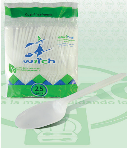
Cuchara XIVAG Biodegradable

Marca. XIVAG Precio Paquete. $15.00 Precio de Caja. $480.00