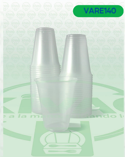
Vaso Plástico VP12

Marca. REYMA Precio Paquete. $62.00 Precio de Caja. $1,160.00