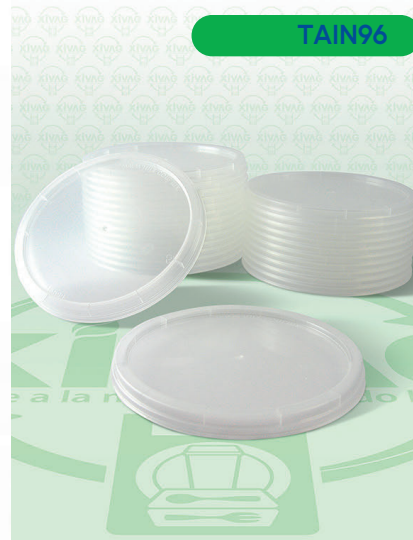
Tapa Lisa Universal para Botes TPP8

Marca. INIX Precio Paquete. $45.00 Precio de Caja. $800.00