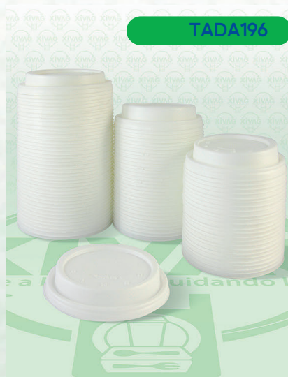
Tapa Blanca Capuchino 16EL

Marca. DART Precio Paquete. $94.00 Precio de Caja. $880.00