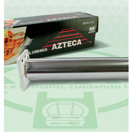
Papel Aluminio Negro Mod. 400 Azteca

Marca. AZTECA Precio Paquete. $300.00 Precio de Caja. $1,710.00