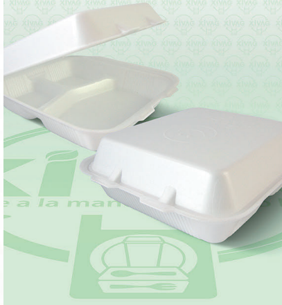
Contenedor Térmico 7X7 Divisiones

Marca. REYMA Precio Paquete. $185.00 Precio de Caja. $720.00