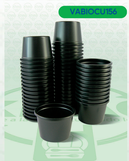
Vaso Núm. 4A Bio Negro

Marca. CUEVAS Precio Paquete. $45.00 Precio de Caja. $1,680.00