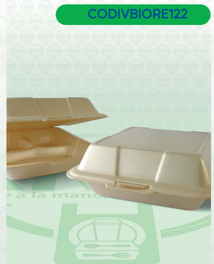
Contenedor Térmico 9X9 Divisiones Biodegradable

Marca. REYMA Precio Paquete. $240.00 Precio de Caja. $940.00