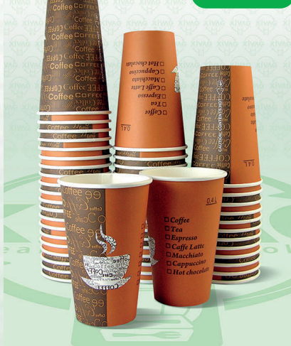
Vaso Luxury Cup Pet 14 oz. LC14

Marca. INIX Precio Paquete. $165.00 Precio de Caja. $3,200.00