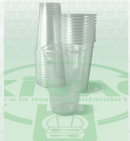
Vaso Plástico VP16L

Marca. REYMA Precio Paquete. $45.00 Precio de Caja. $1,680.00