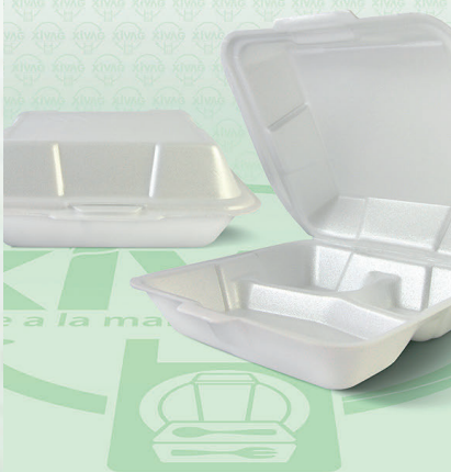
Contenedor Térmico 8X8 Divisiones

Marca. REYMA Precio Paquete. $200.00 Precio de Caja. $780.00