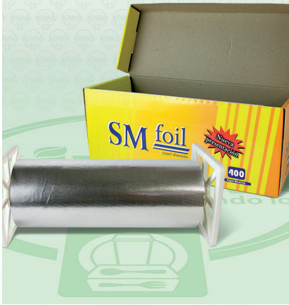
Papel Aluminio SM FOIL Jumbo Amarillo

Marca. AZTECA Precio Paquete. $350.00 Precio de Caja. $2,070.00