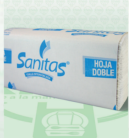
Toalla Int. Sanitas

Marca. KIMBERLY - CLARK Precio Paquete. $22.00 Precio de Caja. $400.00