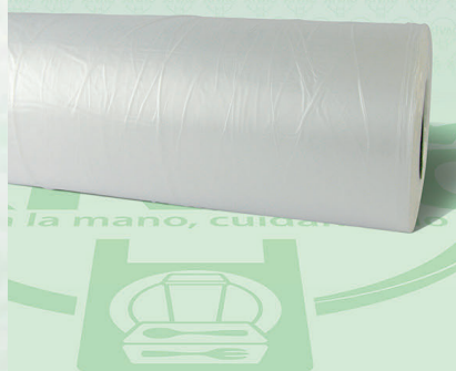
Rollo de Bolsa Polipapel 25X35

Marca. XIVAG Precio Paquete. $120.00 Precio de Caja. $1,320.00