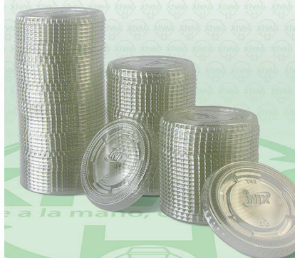
Tapa Plana para Soufflé Transparente 2 oz. TS200

Marca. INIX Precio Paquete. $55.00 Precio de Caja. $500.00