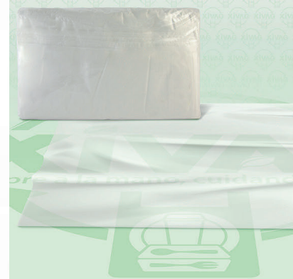
Hoja Polipapel a Granel 25X35

Marca. XIVAG Precio Paquete. $88.00 Precio de Caja. $425.00