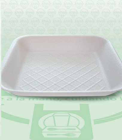
Charola Térmica CH066MA

Marca. REYMA Precio Paquete. $38.00 Precio de Caja. $350.00