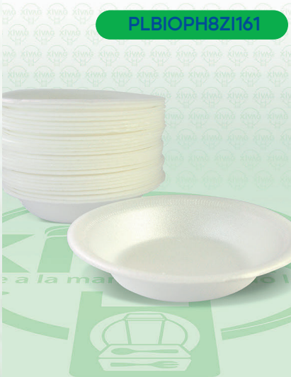
Plato Hondo Biodegradable PH-8

Marca. ZICLART Precio Paquete. $35.00 Precio de Caja. $640.00