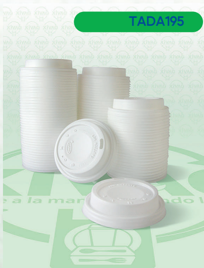
Tapa Blanca Capuchino 10EL

Marca. CUEVAS Precio Paquete. $26.00 Precio de Caja. $480.00