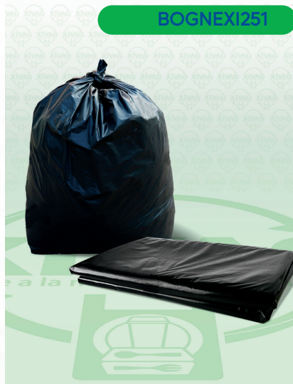
Bolsa a Granel Negra 90X120

Marca. XIVAG Precio Paquete. $65.00 Precio de Caja. $1,500.00