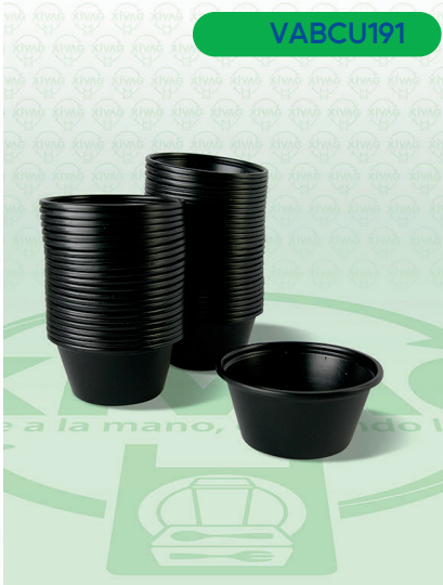
Vaso Bio 3 Negro Soufflé

Marca. CUEVAS Precio Paquete. $26.00 Precio de Caja. $480.00