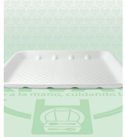
Charola Térmica H9

Marca. REYMA Precio Paquete. $190.00 Precio de Caja. $720.00