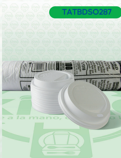
Tapa Traveler Blanca PS Domo Capuccino T316R

Marca. SOLO Precio Paquete. $180.00 Precio de Caja. $1,700.00