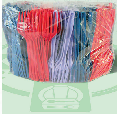
Tenedores a Granel de Plástico de color mate.

Marca. XIVAG Precio Paquete. $125.00 Precio de Caja. $690.00