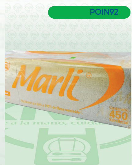
Portavasos 4 Cavidades

Marca. HERMI Precio Paquete. $120.00 Precio de Caja. $440.00