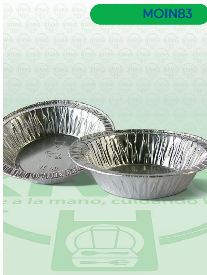
Molde de Aluminio para Tartaleta Individual

Marca. INIX Precio Paquete. $30.00 Precio de Caja. $2,500.00