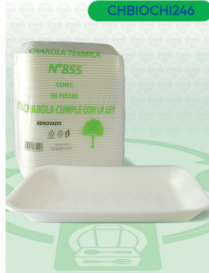
Charola Térmica Biodegradable No. 855

Marca. CHIMEX Precio Paquete. $45.00 Precio de Caja. $420.00