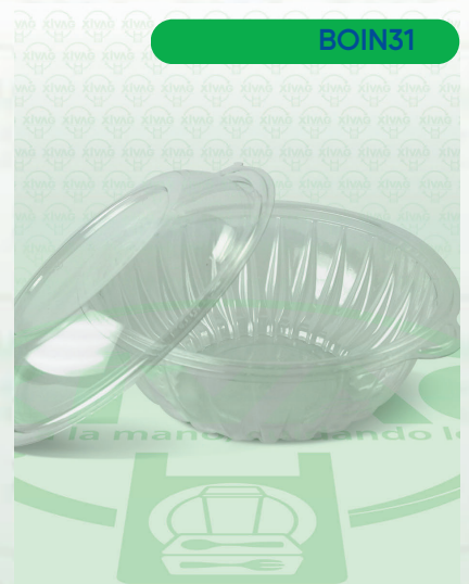
Bowl Transparente para Ensalada FH7-24

Marca. INIX Precio Paquete. $250.00 Precio de Caja. $960.00