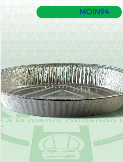
Molde de Aluminio Pavera Ovalada

Marca. INIX Precio Paquete. $35.00 Precio de Caja. $1,500.00