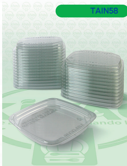
Tapa Plana Cuadrada AD- L1

Marca. INIX Precio Paquete. $40.00 Precio de Caja. $760.00