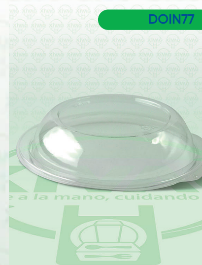
Tapa Domo Transparente para Bowl D5-DP

Marca. INIX Precio Paquete. $220.00 Precio de Caja. $1,680.00