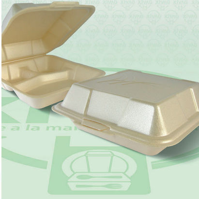
Contenedor Térmico 8X8 Divisiones Biodegradable

Marca. REYMA Precio Paquete. $230.00 Precio de Caja. $900.00