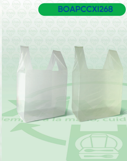
Bolsa de Asa Plástico Color 2 (Camiseta)

Marca. XIVAG Precio Paquete. $65.00 Precio de Caja. $1,500.00