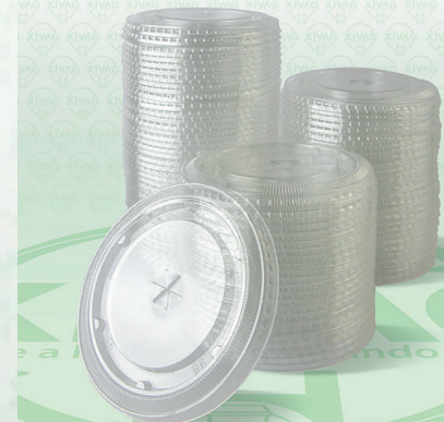
Tapa Luxury Plana con Perforación PL98

Marca. INIX Precio Paquete. $115.00 Precio de Caja. $1,050.00