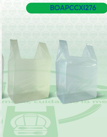
Bolsa de Asa Plástico Color 3 (Camiseta)

Marca. XIVAG Precio Paquete. $65.00 Precio de Caja. $1,500.00