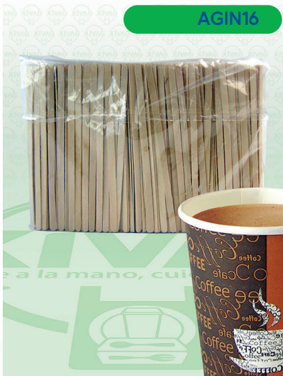
Agitador de Madera Compostable de 14 cm AGIT14-W

Marca. INIX Precio Paquete. $95.00 Precio de Caja. $900.00