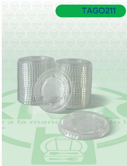
Tapa de Plástico Transparente TL4

Marca. GOPLAS Precio Paquete. $42.00 Precio de Caja. $1,900.00