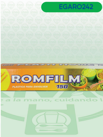
Vitafilm Egapack Estirable 30X150

Marca. ROMFILM Precio Paquete. $86.00 Precio de Caja. $1,595.00