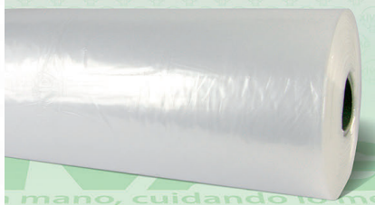
Rollo Plástico Primera Bio 20X30

Marca. XIVAG Precio Paquete. $205.00 Precio de Caja. $1,755.00