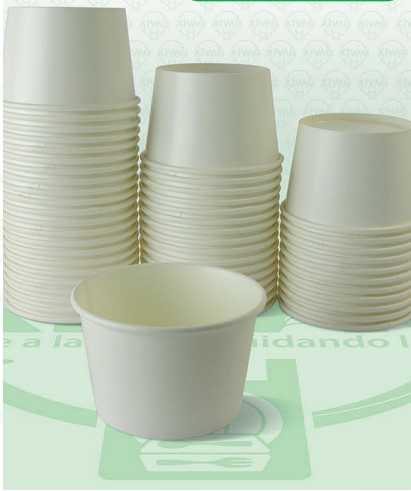
Contenedor Polipropileno de 1 Litro.

Marca. REYMA Precio Paquete. $95.00 Precio de Caja. $1,800.00