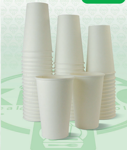
Vaso de Plástico 16 Largo V16-L

Marca. INIX Precio Paquete. $165.00 Precio de Caja. $3,200.00