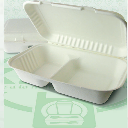
Contenedor 22X14 Compostable Bio-96-2

Marca. INIX Precio Paquete. $290.00 Precio de Caja. $1,120.00