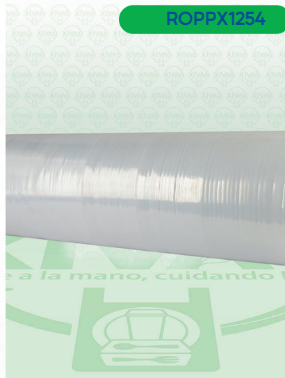
Rollo de Película Plástica Industrial para Embalaje (Playo)

Marca. XIVAG Precio Paquete. $275.00 Precio de Caja. $1,060.00