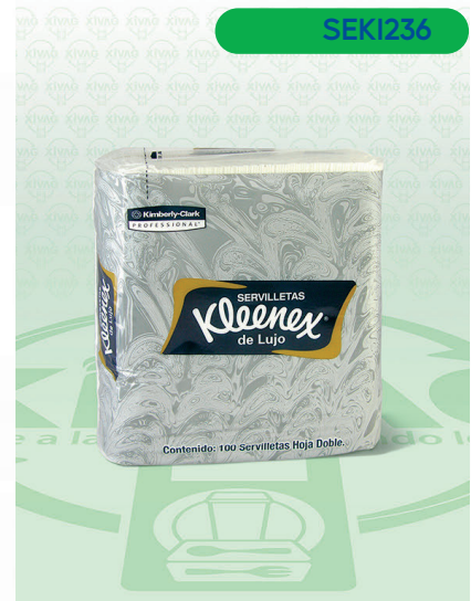
Servilleta 1X1 Marll

Marca. KIMBERLY-CLARK Precio Paquete. $35.00 Precio de Caja. $768.00