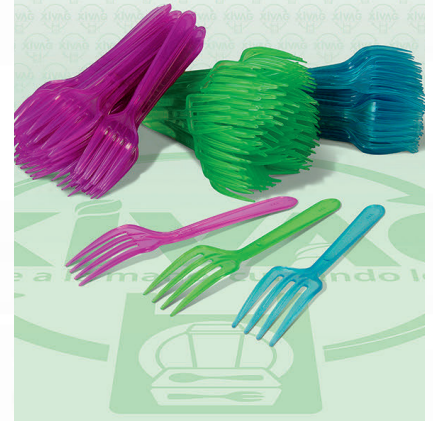
Tenedor Individual Neón

Marca. PLASTICORONA Precio Paquete. $15.00 Precio de Caja. $720.00