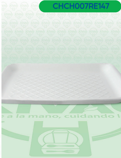
Charola Térmica CH007

Marca. REYMA Precio Paquete. $76.00 Precio de Caja. $720.00