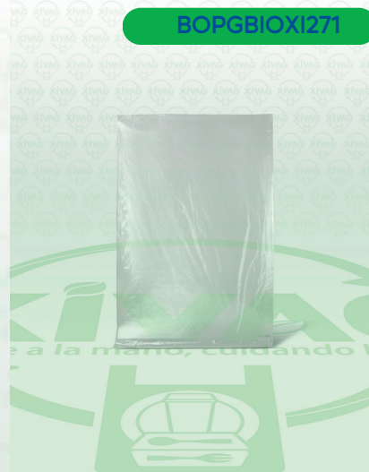
Bolsa Plástico a Granel Bio 25X35

Marca. XIVAG Precio Paquete. $82.00 Precio de Caja. $456.00