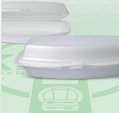
Contenedor para Hot Dog CNHD

Marca. REYMA Precio Paquete. $200.00 Precio de Caja. $780.00