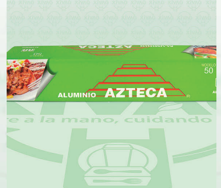
Papel Aluminio Verde Mod. 50 Azteca

Marca. AZTECA Precio Paquete. $65.00 Precio de Caja. $1,440.00