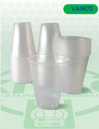
Vaso de Plástico V12

Marca. INIX Precio Paquete. $55.00 Precio de Caja. $1,040.00