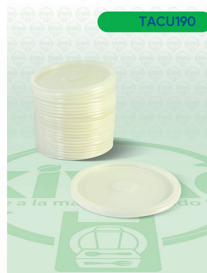
Tapa para Molde de Cristal Molde 20C

Marca. DART Precio Paquete. $105.00 Precio de Caja. $1,00.00