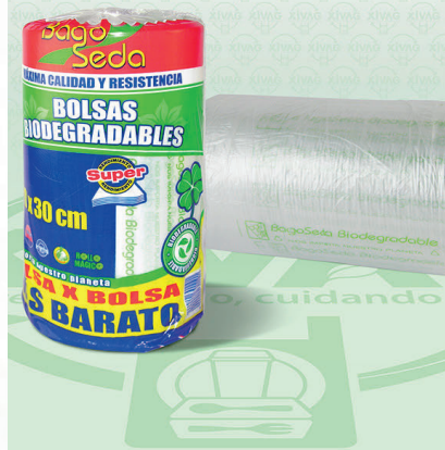
Rollo de Bolsa BagoSeda | Medida 20X30 cm

Marca. LAPOSA Precio Paquete. $170.00 Precio de Caja. $1,485.00