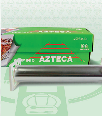
Papel Aluminio Verde Mod. 400 Azteca

Marca. AZTECA Precio Paquete. $300.00 Precio de Caja. $1,710.00