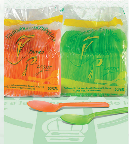
Cuchara Pastelera Colores Ne6n

Marca. XIVAG Precio Paquete. $20.00 Precio de Caja. $900.00