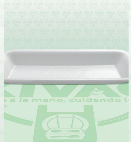
Charola Térmica CH835

Marca. REYMA Precio Paquete. $48.00 Precio de Caja. $450.00