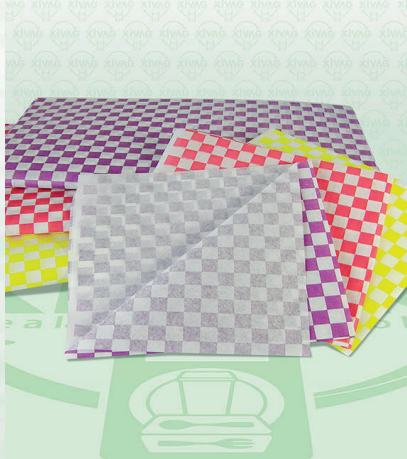
Papel Cuadrulado Encerado de Grado Alimenticio

Marca. PAPELES CAZAR Precio Paquete. $65.00 Precio de Caja. $600.00