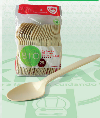
Cuchara Pastelera Bio Classy

Marca. CLASSY Precio Paquete. $15.00 Precio de Caja. $780.00