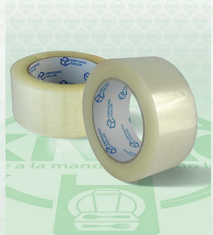
Cinta Adhesiva Transparente Pake Empaques

Marca. PAKE EMPAQUES Precio Paquete. $38.00 Precio de Caja. $1,152.00