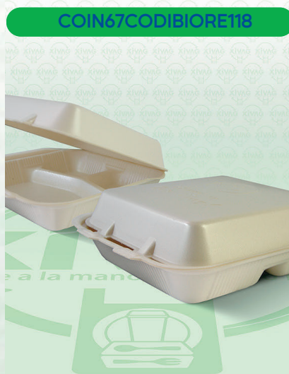
Contenedor Térmico 7X7 Divisiones Biodegradable

Marca. REYMA Precio Paquete. $210.00 Precio de Caja. $820.00