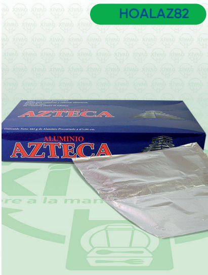
Hojas de Aluminio Azteca

Marca. AZTECA Precio Paquete. $180.00 Precio de Caja. $1,700.00