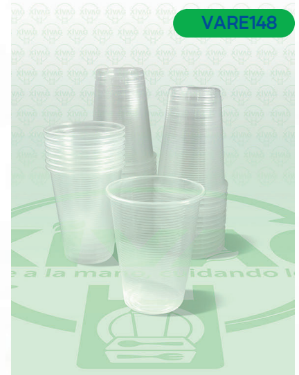
Vaso Plástico VP6

Marca. REYMA Precio Paquete. $46.00 Precio de Caja. $840.00