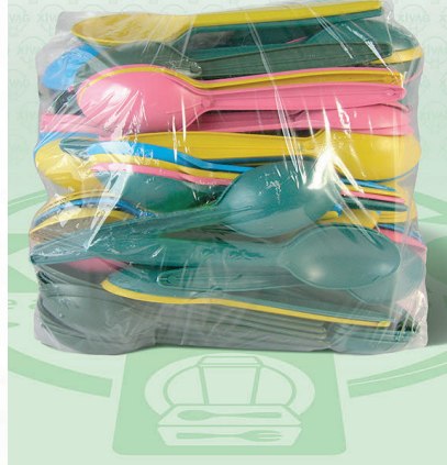
Cuchara de Colores a Granel

Marca. XIVAG Precio Paquete. $125.00 Precio de Caja. $690.00