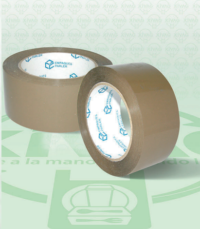
Cinta Adhesiva Canela Lerin

Marca. LERIN Precio Paquete. $38.00 Precio de Caja. $1,052.00