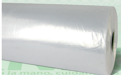
Rollo Plástico Primera Bio 25X35

Marca. XIVAG Precio Paquete. $270.00 Precio de Caja. $1,560.00