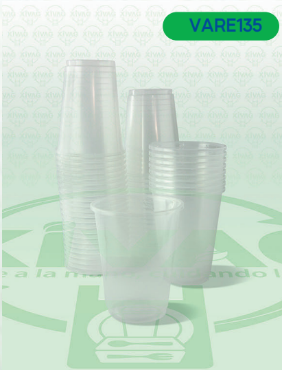
Vaso Plástico VP10

Marca. REYMA Precio Paquete. $60.00 Precio de Caja. $1,100.00