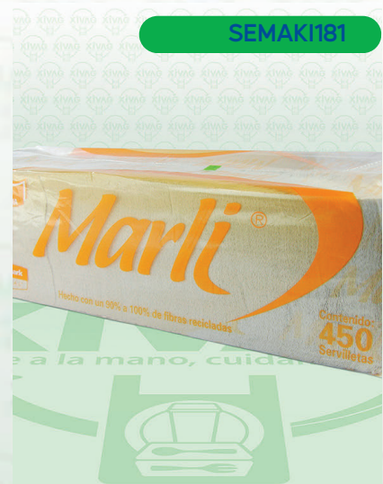
Servilleta Trad Marli

Marca. KIMBERLY - CLARK Precio Paquete. $58.00 Precio de Caja. $648.00