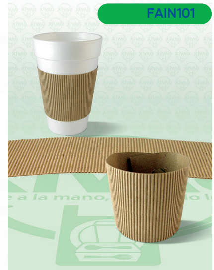
Fajilla Tipo Cinturón para Vaso Body Cup

Marca. INIX Precio Paquete. $125.00 Precio de Caja. $1,200.00