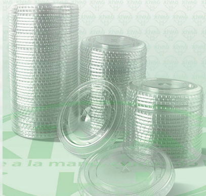
Tapa Luxury Plana con Perforación para Vaso 14 oz. PL92

Marca. INIX Precio Paquete. $85.00 Precio de Caja. $800.00