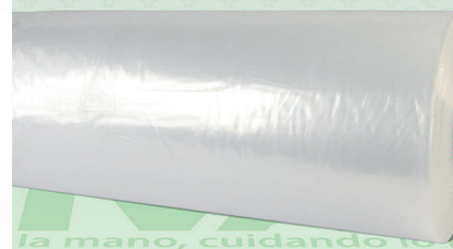
Rollo Plástico Primera Bio 40X60

Marca. XIVAG Precio Paquete. $295.00 Precio de Caja. $1,140.00