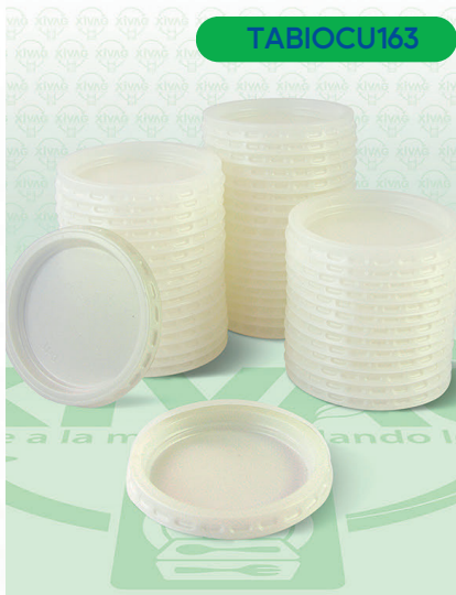
Tapa 4A Bio

Marca. CUEVAS Precio Paquete. $25.00 Precio de Caja. $460.00