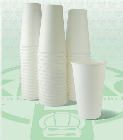
Vaso de Papel Económico Blanco 12 oz. VPP12

Marca. MRBEE Precio Paquete. $170.00 Precio de Caja. $3,300.00