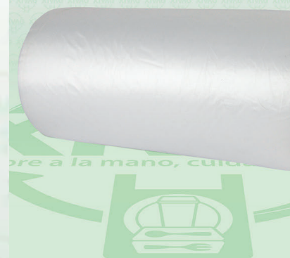
Rollo de Bolsa Polipapel 20X30

Marca. XIVAG Precio Paquete. $105.00 Precio de Caja. $1,140.00