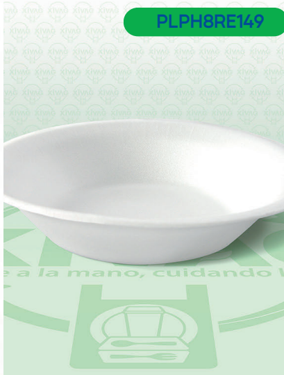
Plato Térmico PH8 Hondo

Marca. REYMA Precio Paquete. $36.00 Precio de Caja. $660.00