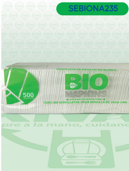
Servilleta Bio Napkins

Marca. NAPKINS Precio Paquete. $65.00 Precio de Caja. $744.00