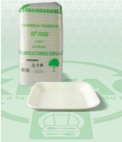
Charola 066 Térmica Biodegradable

Marca. CHIMEX Precio Paquete. $35.00 Precio de Caja. $320.00