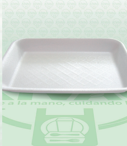
Charola Térmica CH855RE

Marca. REYMA Precio Paquete. $52.00 Precio de Caja. $500.00