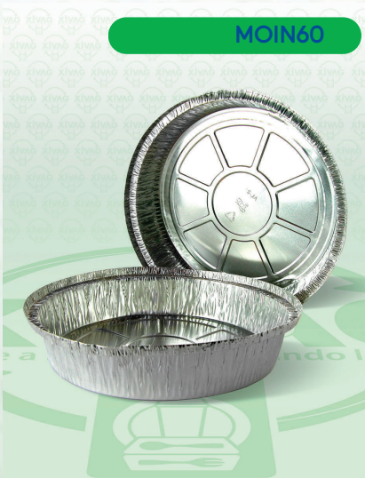
Molde de Aluminio con Ceja para Flan AL-21

Marca. INIX Precio Paquete. $120.00 Precio de Caja. $2,750.00