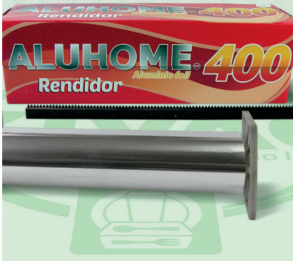
Papel Aluminio Aluhome Rojo Mod. 400

Marca. ALUHOME Precio Paquete. $295.00 Precio de Caja. $1,680.00