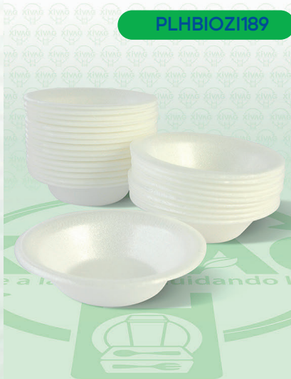
Plato Hondo Biodegradable PH-4

Marca. ZICLART Precio Paquete. $20.00 Precio de Caja. $360.00