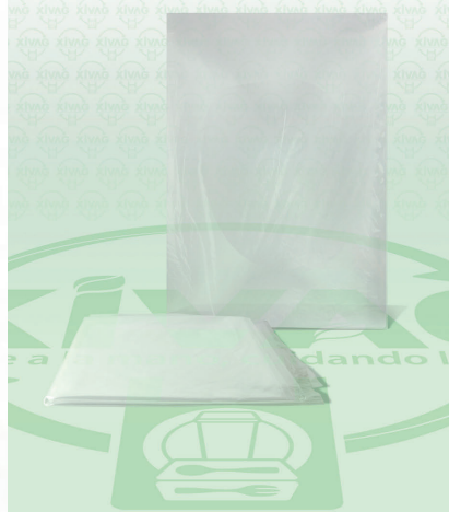
Bolsa Plástico a Granel Bio 50X70

Marca. XIVAG Precio Paquete. $80.00 Precio de Caja. $1,875.00