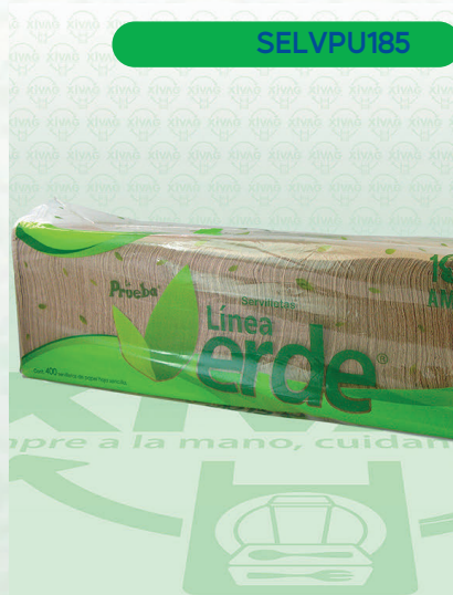
Servilleta Ecológica Línea Verde

Marca. PRUEBA Precio Paquete. $44.00 Precio de Caja. $480.00