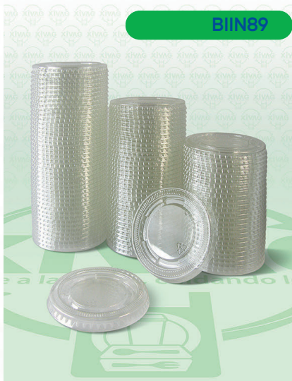
Tapa Luxury para Vasos Tipo Cristal L77

Marca. INIX Precio Paquete. $60.00 Precio de Caja. $560.00