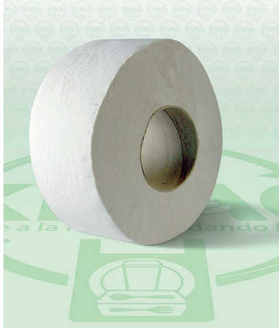
Papel Higiénico Junior Institucional

Marca. INSTITUCIONAL Precio Paquete. $35.00 Precio de Caja. $360.00