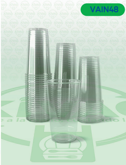
Vaso Luxury Cup Pet 22 oz. LC22

Marca. INIX Precio Paquete. $105.00 Precio de Caja. $950.00