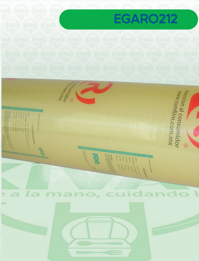
Vitafilm Egapack Estirable 30X600

Marca. EGA PACK Precio Paquete. $180.00 Precio de Caja. $1,050.00