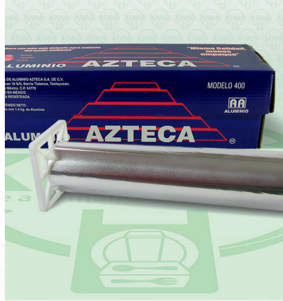
Papel Aluminio Azul Mod. 400 Azteca

Marca. AZTECA Precio Paquete. $370.00 Precio de Caja. $2,100.00