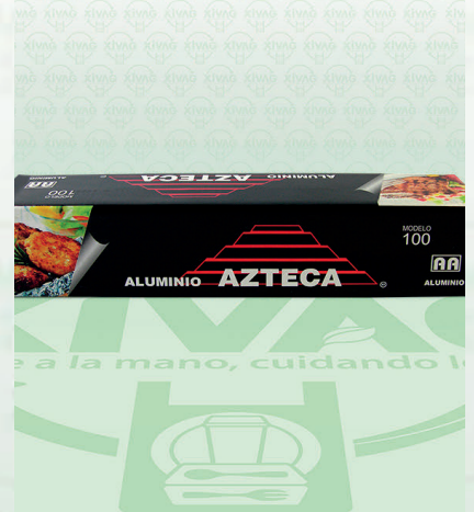
Papel Aluminio Negro Mod. 100 Azteca

Marca. AZTECA Precio Paquete. $175.00 Precio de Caja. $1,920.00