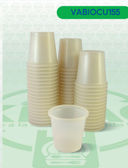
Vaso Núm. 4 1/2 Bio

Marca. CUEVAS Precio Paquete. $42.00 Precio de Caja. $1,600.00