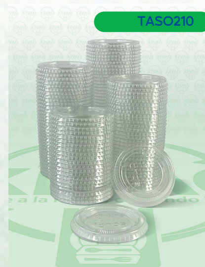
Tapa para Soufflé Solo PL200N

Marca. DART Precio Paquete. $165.00 Precio de Caja. $1,600.00