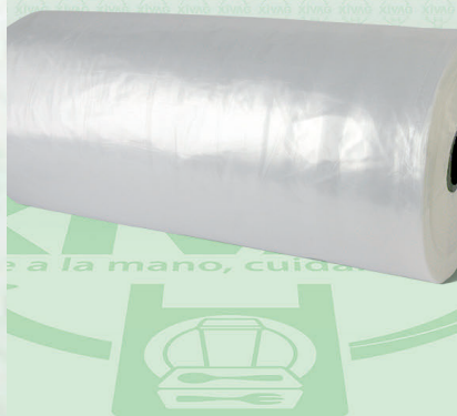
Hoja en Rollo Polipapel 25X35

Marca. XIVAG Precio Paquete. $95.00 Precio de Caja. $510.00