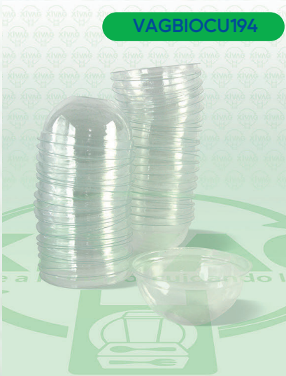
Vaso Gelat 16-C Bio

Marca. CUEVAS Precio Paquete. $64.00 Precio de Caja. $1,200.00