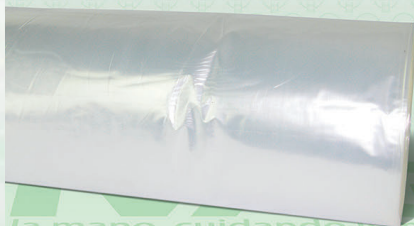
Rollo Plástico Primera Bio 35X45

Marca. XIVAG Precio Paquete. $295.00 Precio de Caja. $1,710.00