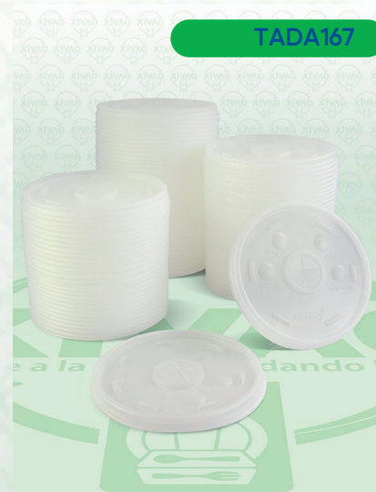
Tapa Traslúcida con Orificio para Popote 16SLMX

Marca. DART Precio Paquete. $105.00 Precio de Caja. $1,000.00