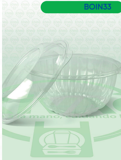
Bowl Transparente para Ensalada FH7-48

Marca. INIX Precio Paquete. $330.00 Precio de Caja. $1,280.00