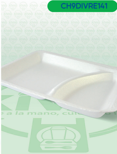
Charola Térmica No. 9 con 2 Divisiones

Marca. REYMA Precio Paquete. $38.00 Precio de Caja. $700.00