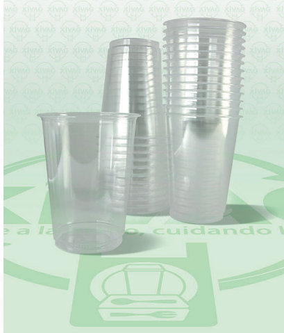
Vaso para Bebida Caliente 12 oz.

Marca. GOPLAS Precio Paquete. $65.00 Precio de Caja. $2,400.00