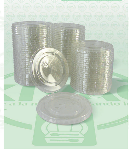
Tapa Transparente Perforada Lisa (Pactiv) 20 oz.

Marca. JAGUAR Precio Paquete. $100.00 Precio de Caja. $1,140.00