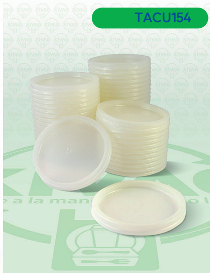
Tapa de Plástico Bio Lisa No.16 y 1/4 A1424

Marca. CUEVAS Precio Paquete. $38.00 Precio de Caja. $700.00