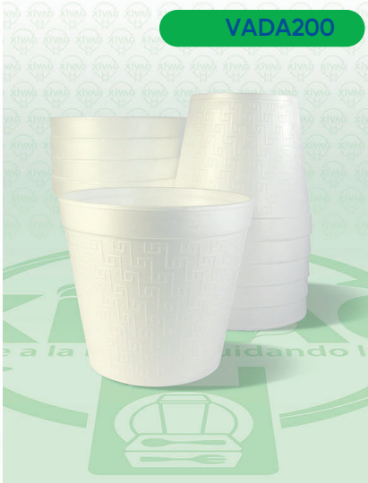
Vaso Térmico 60JY60

Marca. DART Precio Paquete. $62.00 Precio de Caja. $1,740.00