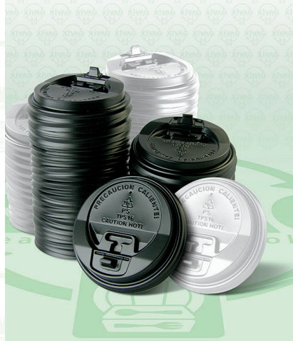
Tapa Viajera para Vaso de Papel 12, 16 y 20 oz. TPS16N

Marca. INIX Precio Paquete. $80.00 Precio de Caja. $1,500.00