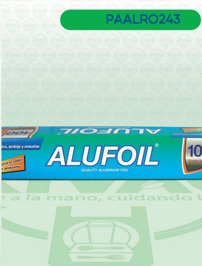
Servilleta Tradicional Pétalo

Marca. ROMFILM Precio Paquete. $95.00 Precio de Caja. $2,160.00