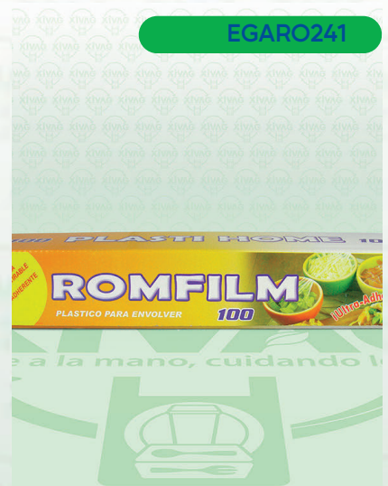
Vitafilm Egapack Estirable 30X100

Marca. EGA PACK Precio Paquete. $65.00 Precio de Caja. $2,750.00