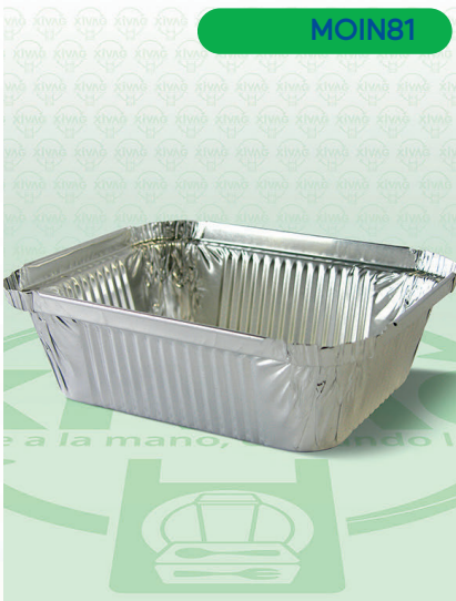
Molde de Aluminio AL-1310

Marca. INIX Precio Paquete. $70.00 Precio de Caja. $1,950.00