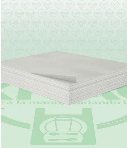
Papel Estraza Blanco en Pliego Grado Alimenticio

Marca. PAPELES CAZAR Precio Paquete. $52.00 Precio de Caja. $1,250.00