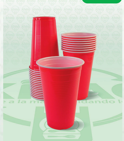
Vaso Luxury Cup Pet 16 oz. LC16

Marca. INIX Precio Paquete. $45.00 Precio de Caja. $1,600.00