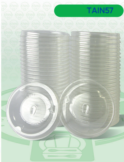
Tapa con Perforación para 16RPET L90

Marca. INIX Precio Paquete. $40.00 Precio de Caja. $760.00