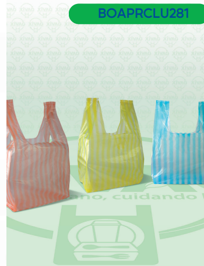
Bolsa de Asa de Poliseda Rayada 0 (Camiseta)

Marca. LUNA Precio Paquete. $95.00 Precio de Caja. $2,250.00