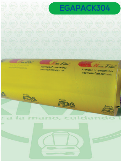
Vitafilm Egapack Estirable D-3X35

Marca. EGA PACK Precio Paquete. $400.00 Precio de Caja. $780.00