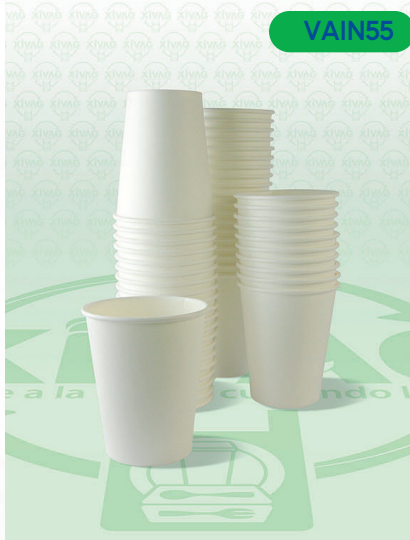
Vaso para Bebida Caliente 12 oz.

Marca. MRBEE Precio Paquete. $150.00 Precio de Caja. $2,800.00