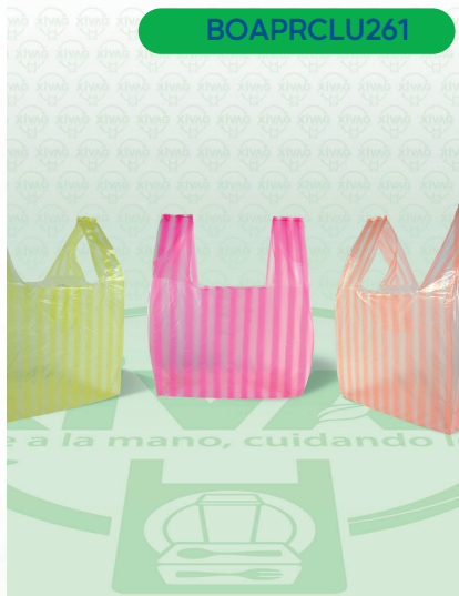
Bolsa de Asa de Poliseda Rayada 1 (Camiseta)

Marca. LUNA Precio Paquete. $95.00 Precio de Caja. $2,250.00