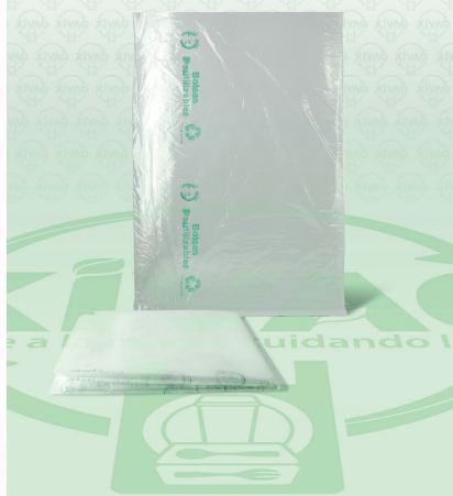
Bolsa Plástico a Granel Bio 40X60

Marca. XIVAG Precio Paquete. $80.00 Precio de Caja. $1,950.00