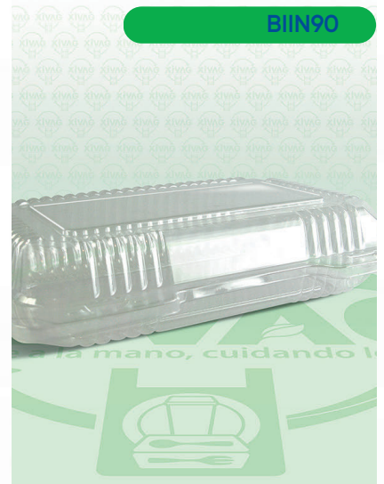
Bisagra 2020 - 43

Marca. INIX Precio Paquete. $330.00 Precio de Caja. $1,600.00