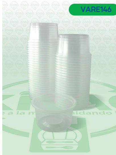
Vaso Plástico VP4A.

Marca. REYMA Precio Paquete. $40.00 Precio de Caja. $760.00