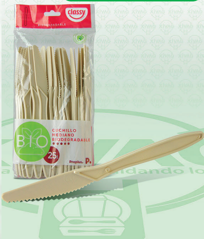
Cuchillo Mediano Bio Classy

Marca. CLASSY Precio Paquete. $26.00 Precio de Caja. $960.00