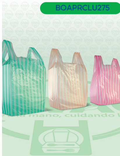
Bolsa de Asa de Poliseda Rayada 3 (Camiseta)

Marca. LUNA Precio Paquete. $95.00 Precio de Caja. $2,250.00