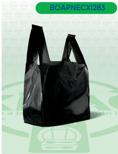
Bolsa de Asa de Plástico Negra 3 (Camiseta)

Marca. XIVAG Precio Paquete. $65.00 Precio de Caja. $1,500.00