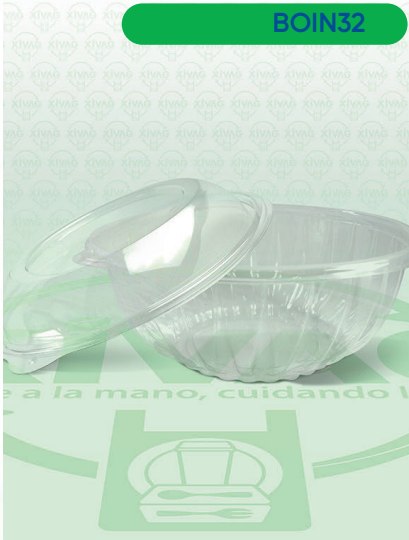
Bowl Transparente para Ensalada FH7-32

Marca. INIX Precio Paquete. $265.00 Precio de Caja. $1,020.00