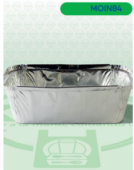
Molde de Aluminio para Panqué

Marca. INIX Precio Paquete. $105.00 Precio de Caja. $4,750.00