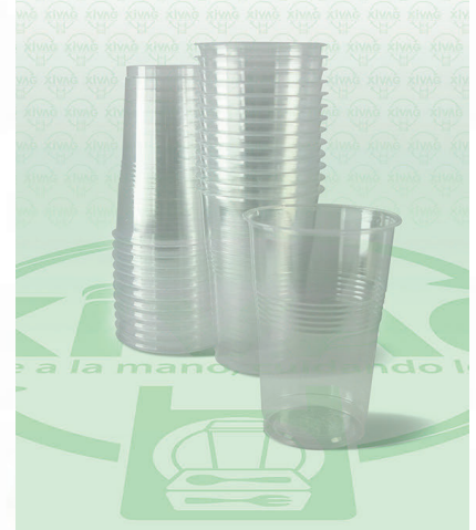
Vaso de Plástico V8 V8-TR

Marca. GOPLAS Precio Paquete. $75.00 Precio de Caja. $2,800.00