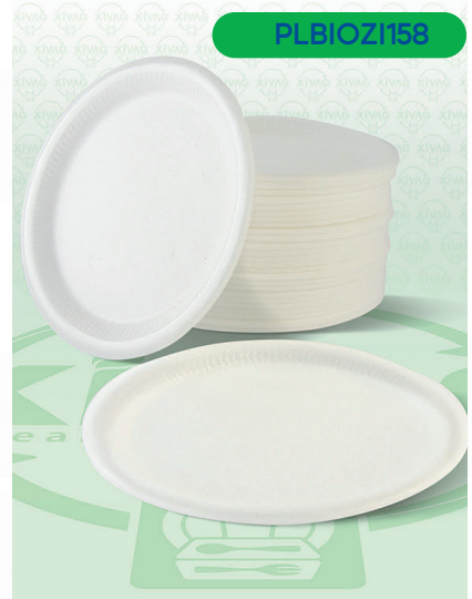
Plato Biodegradable (Pastelero) P-006

Marca. ZICLART Precio Paquete. $25.00 Precio de Caja. $460.00