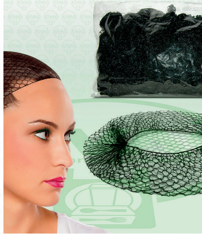
Red Negra para Cabello

Marca. INIX Precio Paquete. $145.00 Precio de Caja. $10,400.00