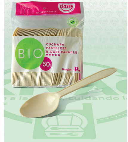
Cuchara Mediana Bio Classy

Marca. CLASSY Precio Paquete. $16.00 Precio de Caja. $560.00