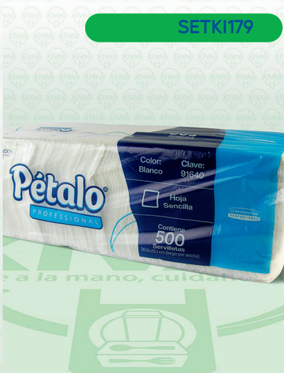
Servilleta Tradicional Pétalo

Marca. KIMBERLY - CLARK Precio Paquete. $105.00 Precio de Caja. $1,200.00