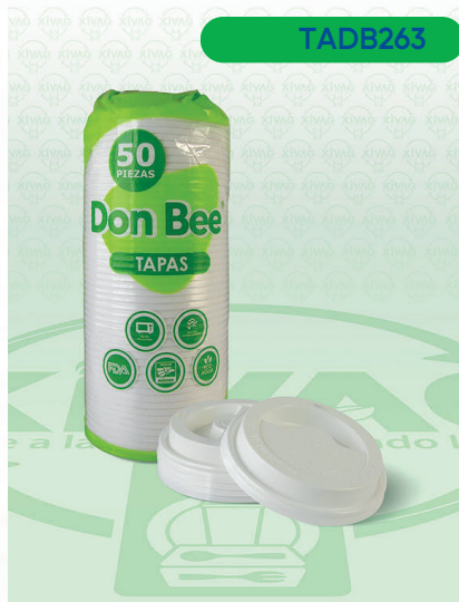
Tapa Universal Blanca MrBee

Marca. DON BEE Precio Paquete. $95.00 Precio de Caja. $1,760.00