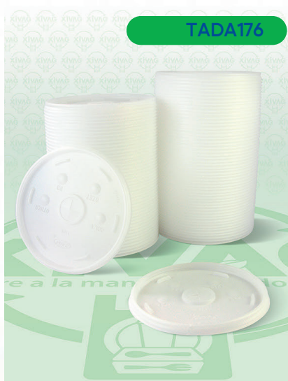
Tapa Traslúcida con Ranura para Popote Sorbete 32SLMX

Marca. DART Precio Paquete. $140.00 Precio de Caja. $1,350.00