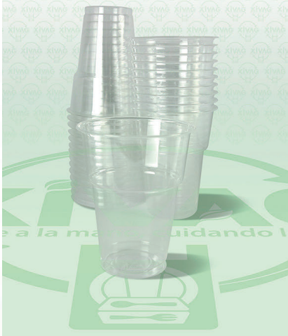
Vaso Goplas Cristal 8 oz.

Marca. GOPLAS Precio Paquete. $56.00 Precio de Caja. $2,080.00