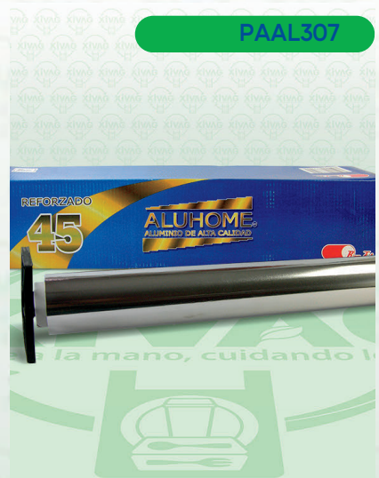
Papel Aluminio Aluhome 45x100

Marca. ALUHOME Precio Paquete. $340.00 Precio de Caja. $2,520.00