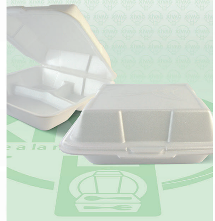
Contenedor Térmico 9X9 Divisiones

Marca. REYMA Precio Paquete. $210.00 Precio de Caja. $820.00