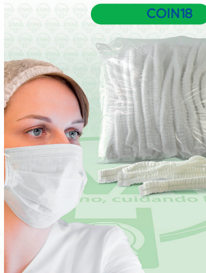
Cofia Blanca Desechable

Marca. INIX Precio Paquete. $95.00 Precio de Caja. $900.00