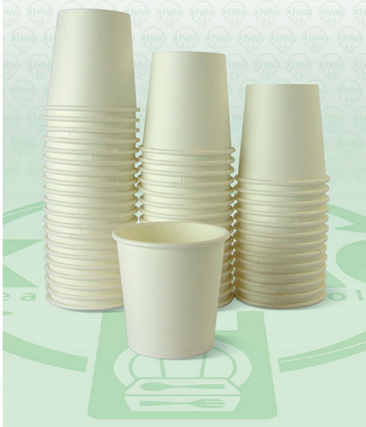
Vaso Tipo Soufflé Traslúcido de 1 oz. S100

Marca. INIX Precio Paquete. $52.00 Precio de Caja. $1,000.00