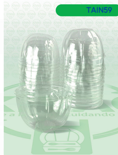
Tapa Domo Ciega para 24 y 32 RPP DL110

Marca. INIX Precio Paquete. $35.00 Precio de Caja. $600.00