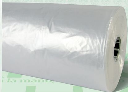
Rollo Plástico Primera Bio 30X40

Marca. XIVAG Precio Paquete. $370.00 Precio de Caja. $8,750.00