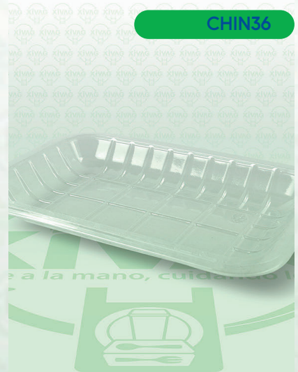
Charola PET 855L-250

Marca. INIX Precio Paquete. $105.00 Precio de Caja. $500.00