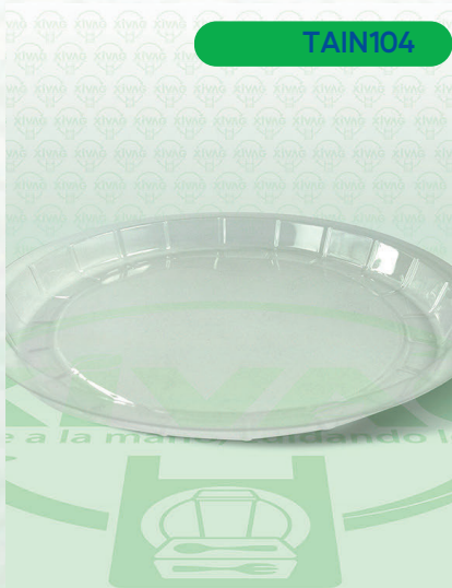
Domo Plástico para Molde AD-21-250

Marca. INIX Precio Paquete. $42.00 Precio de Caja. $1,000.00