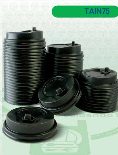
Tapa Negra Viajera para Vaso de Papel TPS04N

Marca. INIX Precio Paquete. $52.00 Precio de Caja. $960.00