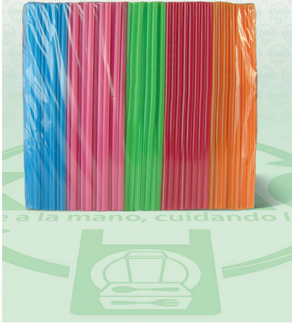
Popete de Colores

Marca. HERMI Precio Paquete. $95.00 Precio de Caja. $450.00