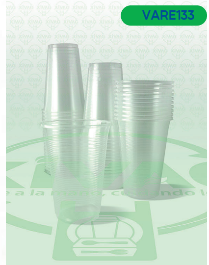
Vaso Plástico VP8

Marca. REYMA Precio Paquete. $48.00 Precio de Caja. $900.00