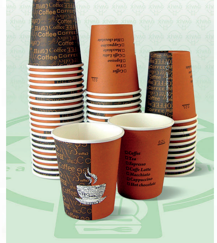
Vaso Tipo Soufflé Traslúcido de 4 oz. S400

Marca. INIX Precio Paquete. $95.00 Precio de Caja. $1,800.00