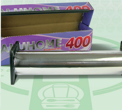
Papel Aluminio Aluhome Reforzado Mod. 400

Marca. ALUHOME Precio Paquete. $290.00 Precio de Caja. $1,680.00