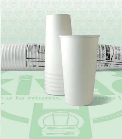
Vaso de Plástico V12

Marca. SOLO Precio Paquete. $185.00 Precio de Caja. $2,625.00