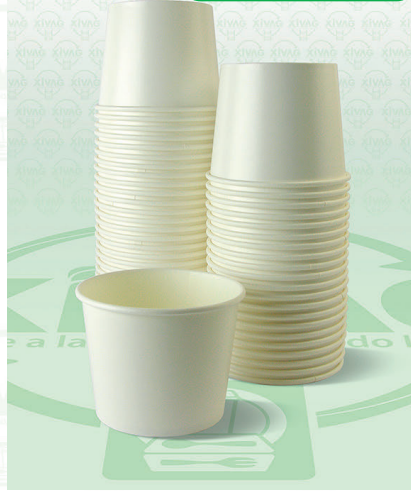
Contenedor Polipropileno de 1/2 Litro.

Marca. REYMA Precio Paquete. $75.00 Precio de Caja. $1,400.00