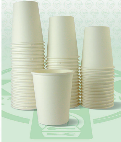
Vaso Tipo Soufflé Traslúcido de 2 oz. S200

Marca. INIX Precio Paquete. $95.00 Precio de Caja. $1,800.00