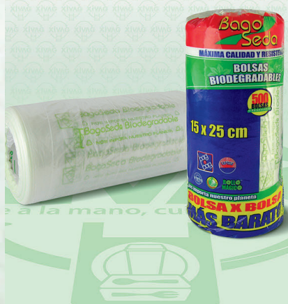
Rollo de Bolsa BagoSeda | Medida 15X25 cm | 500 pzas.

Marca. LAPOSA Precio Paquete. $45.00 Precio de Caja. $800.00