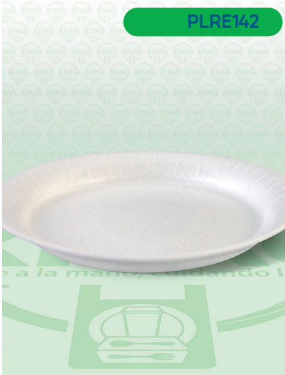
Plato Térmico Pastelero 006

Marca. REYMA Precio Paquete. $42.00 Precio de Caja. $1,900.00