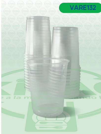
Vaso Plástico VP16A

Marca. REYMA Precio Paquete. $45.00 Precio de Caja. $1,680.00