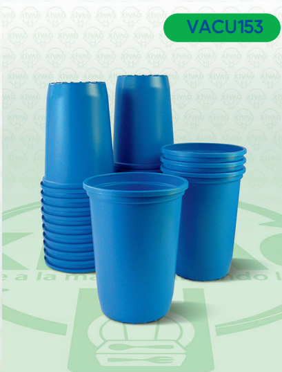
Vaso Núm. 16 Azul A1542

Marca. REYMA Precio Paquete. $46.00 Precio de Caja. $840.00