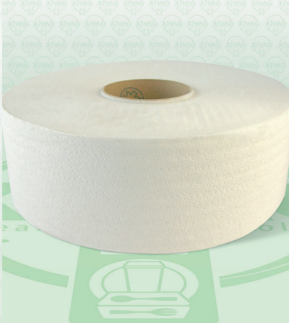
Papel Higiénico Jumbo Marli

Marca. KIMBERLY - CLARK Precio Paquete. $105.00 Precio de Caja. $600.00