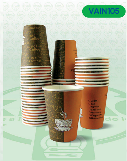
Vaso de Papel Económico Impreso Coffee 12 oz. VPP12C

Marca. INIX Precio Paquete. $135.00 Precio de Caja. $2,500.00