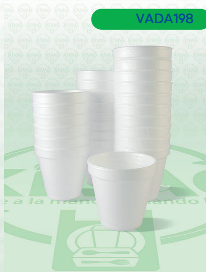
Vaso Térmico 4J4R

Marca. DART Precio Paquete. $20.00 Precio de Caja. $720.00