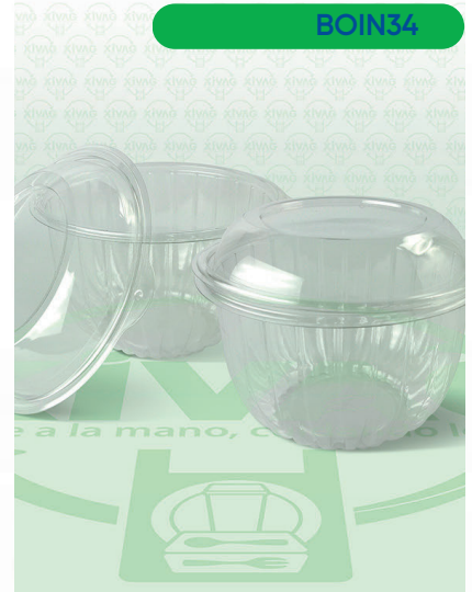
Bowl Transparente para Ensalada FH7-64

Marca. INIX Precio Paquete. $360.00 Precio de Caja. $1,400.00