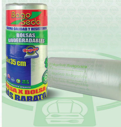
Rollo de Bolsa BagoSeda | Medida 25X35 cm

Marca. LAPOSA Precio Paquete. $195.00 Precio de Caja. $1,140.00