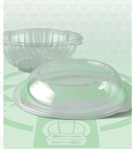
Tapa Domo Transparente para Bowl D7-DP

Marca. INIX Precio Paquete. $190.00 Precio de Caja. $720.00