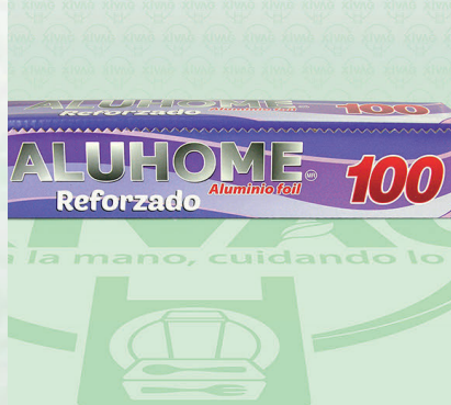
Papel Aluminio Aluhome Reforzado Mod. 100

Marca. ALUHOME Precio Paquete. $130.00 Precio de Caja. $3,125.00