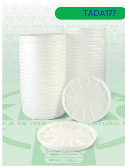
Tapa Térmica con Respiradero 32RL

Marca. DART Precio Paquete. $140.00 Precio de Caja. $1,350.00