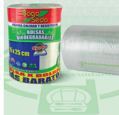
Rollo de Bolsa BagoSeda | Medida 15X25 cm

Marca. LAPOSA Precio Paquete. $105.00 Precio de Caja. $1,200.00