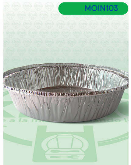
Molde de Aluminio para Pay Aluminio AL-21

Marca. INIX Precio Paquete. $105.00 Precio de Caja. $5,000.00