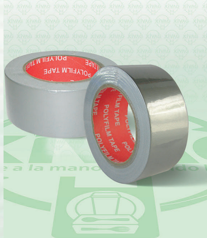
Cinta Adhesiva Gris Industrial

Marca. LERIN Precio Paquete. $105.00 Precio de Caja. $3,420.00