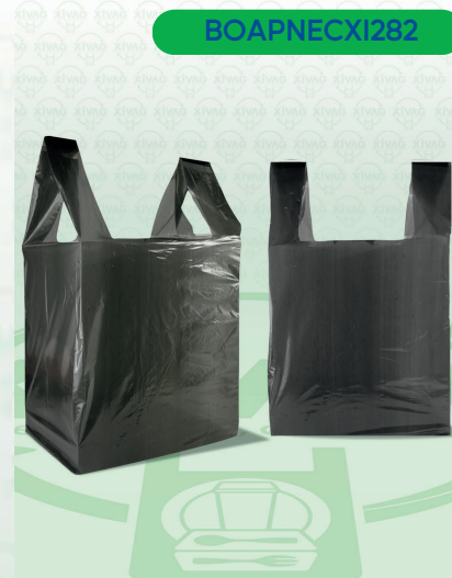
Bolsa de Asa de Plástico Negra 2 (Camiseta)

Marca. XIVAG Precio Paquete. $65.00 Precio de Caja. $1,500.00