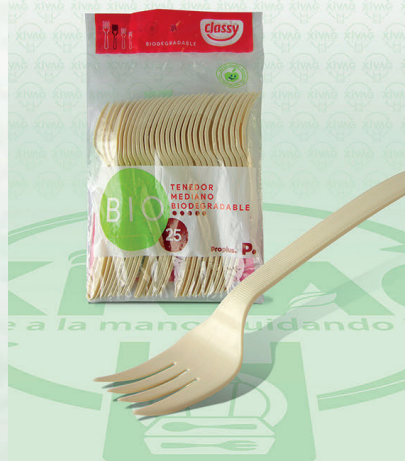
Tenedor Pastelero Bio Classy

Marca. CLASSY Precio Paquete. $15.00 Precio de Caja. $780.00