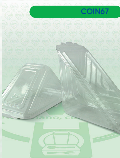
Contenedor Triangular para Sandwich FST1709

Marca. INIX Precio Paquete. $220.00 Precio de Caja. $1,050.00