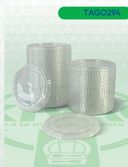
Tapa Transparente con Orificio TRP 95

Marca. GOPLAS Precio Paquete. $80.00 Precio de Caja. $1,500.00