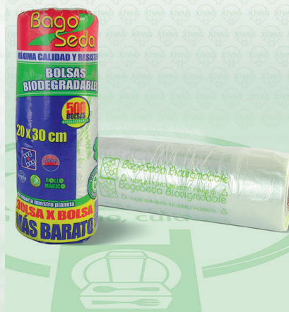
Rollo de Bolsa BagoSeda | Medida 20X30 cm | 500 pzas.

Marca. LAPOSA Precio Paquete. $55.00 Precio de Caja. $1,000.00