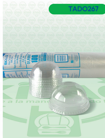
Tapa Domo con Abertura DLR662

Marca. SOLO Precio Paquete. $195.00 Precio de Caja. $1,800.00