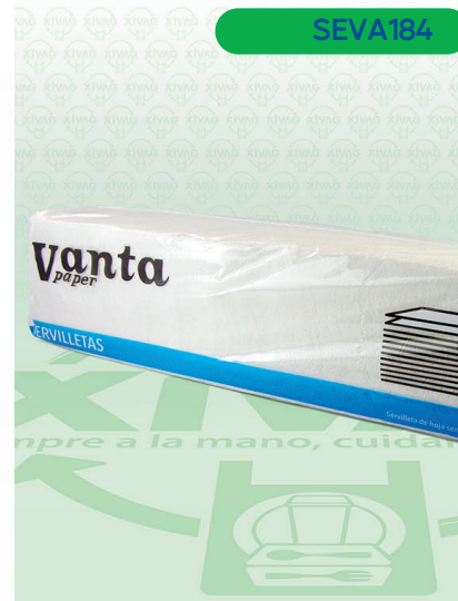
Papel Higiénico Jumbo Marli Junior

Marca. KIMBERLY-CLARK Precio Paquete. $48.00 Precio de Caja. $528.00