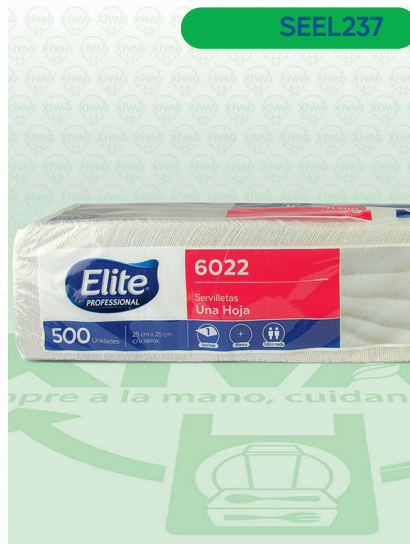
Servilleta Elite Professional

Marca. ELITE Precio Paquete. $75.00 Precio de Caja. $840.00