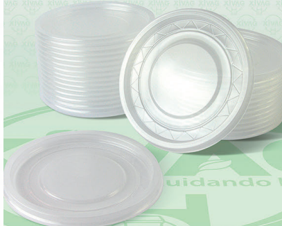
Tapa Universal para Botes TPP8

Marca. INIX Precio Paquete. $36.00 Precio de Caja. $660.00