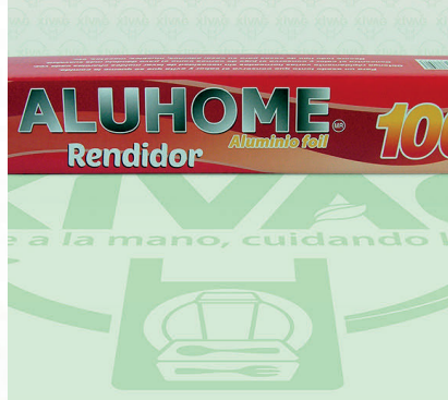
Papel Aluminio Aluhome Rojo Mod. 100

Marca. ALUHOME Precio Paquete. $120.00 Precio de Caja. $2,750.00