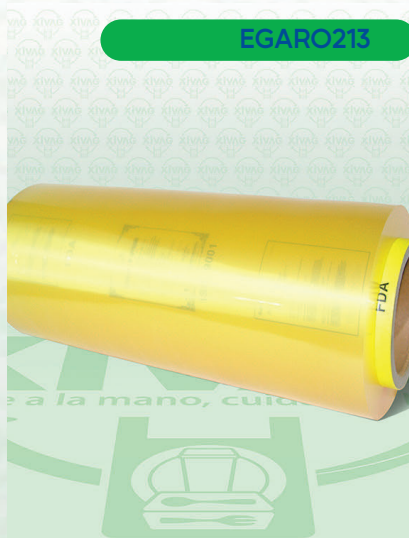
Vitafilm Egapack Estirable 30X1200

Marca. EGA PACK Precio Paquete. $350.00 Precio de Caja. $680.00