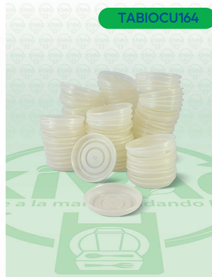
Tapa para Vaso O Bio

Marca. CUEVAS Precio Paquete. $25.00 Precio de Caja. $460.00