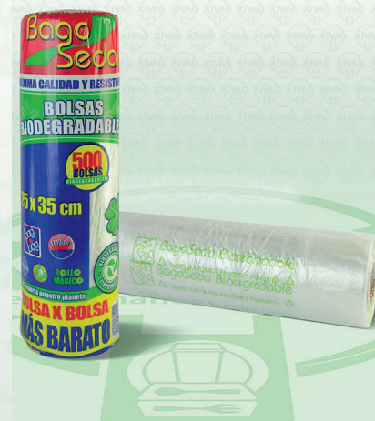
Rollo de Bolsa BagoSeda | Medida 25X35 cm | 500 pzas.

Marca. LAPOSA Precio Paquete. $75.00 Precio de Caja. $700.00