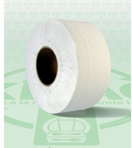
Papel Higiénico Jumbo Marli Junior

Marca. KIMBERLY-CLARK Precio Paquete. $50.00 Precio de Caja. $140.00