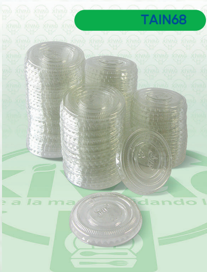
Tapa para Soufflé Transparente 1 oz. T51

Marca. INIX Precio Paquete. $28.00 Precio de Caja. $450.00