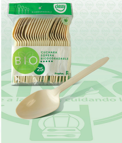
Cuchara Sopera Bio Classy

Marca. CLASSY Precio Paquete. $19.00 Precio de Caja. $680.00