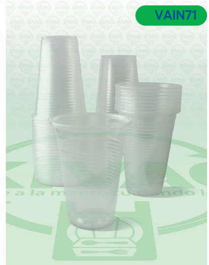
Vaso de Plástico V8 V8-TR

Marca. INIX Precio Paquete. $35.00 Precio de Caja. $600.00